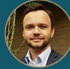
Petr Binhac MPO ČR